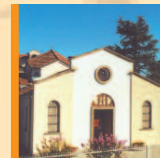
Rovigo: chiesa-santuario «Beata Vergine Addolorata».

• La chiesa-santuario, custode della prodigiosa immagine della Vergine Addolorata, promuove la preghiera liturgica e una genuina pietà popolare, accoglie i pellegrini, offre spazi di silenzio per la riflessione e per la preghiera personale, propone iniziative di solidarietà.