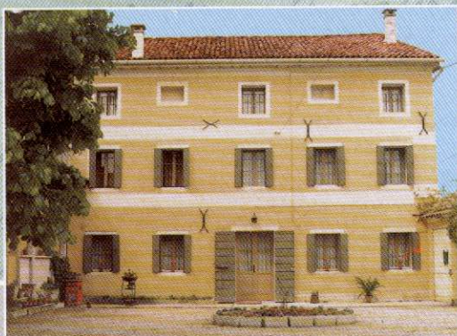
Vidor (Treviso): parte della casa delle origini.