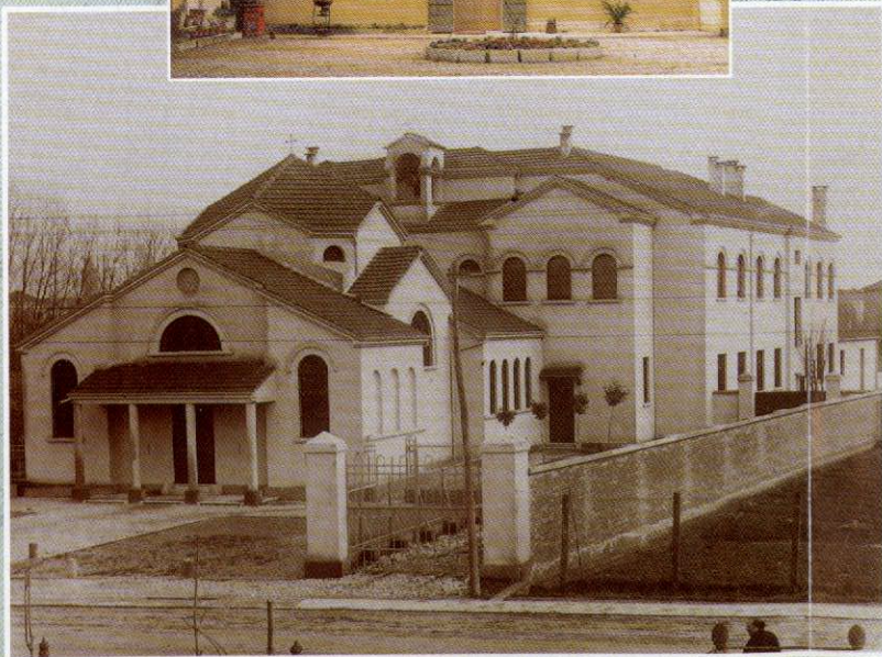
Rovigo: chiesa dell'Addolorata e casa di noviziato all'epoca dell'inaugurazione, nel 1932.

renza le procura il processo intentato dai massoni della città per sottrarle la "proprietà Oriani".